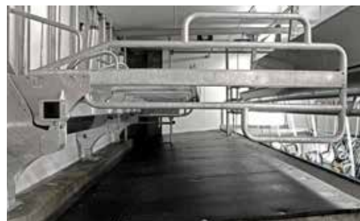
Porte de sortie fermée.