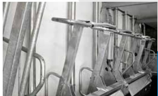
Alimentation auge inox.