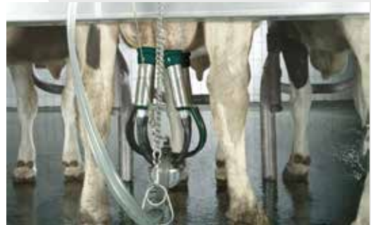
Guide tuyau Counter Balance.