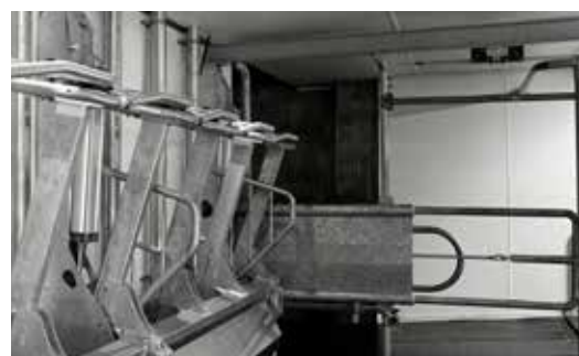
Porte de sortie ouverte.