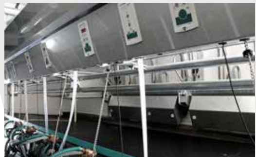
Coffre Inox intégrale.